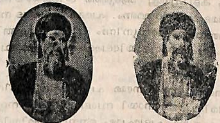
ഡിസൽവ കോശിയും കടുബവും, ന്യൂഡൽഹി.